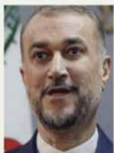
حسین امیرعبداللہیان وزیر امور خارجه