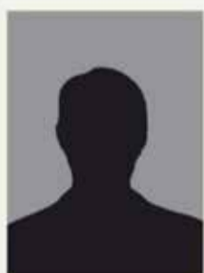
سردار سید مہدی موسوی