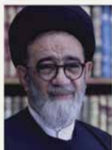
سید محمدعلی آل ہاشم امام جمعہ ائیریز و نمایندہ ولی فقیہ در استان آذربایجان شرقی