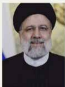
ابراهیم رئیسی رئیس جمهوری